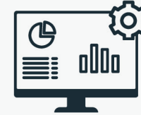
Système de gestion du bâtiment