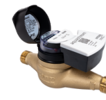
aquabasic® PMK Compteur d'eau domestique avec aquastream®-module de communication