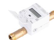
TOPAS® ESK2 Compteur intelligent d'eau à ultrasons